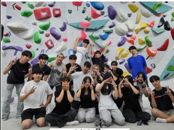
9/19 (목) 클린이 교육&정기 운동 🥳