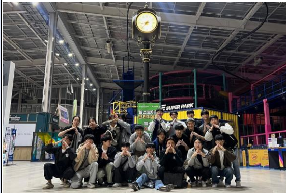
11/4 정기운동 고생 많으셨습니다~❤