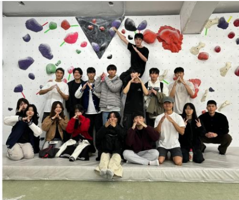
📍 큐클라임 11/14 정기운동 🥳