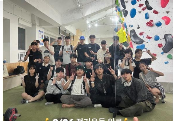
🥳 9/26 정기운동 완료 🥳