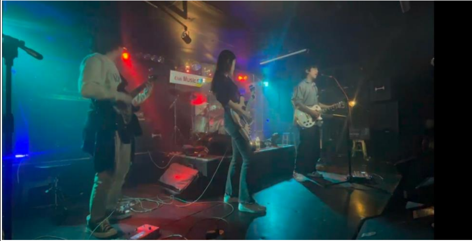
설명 : 성수 ‘뮤직스페이스’ 연합공연 공연 모습