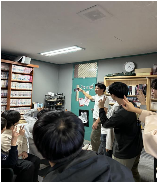
활동사진 (3매 이상)