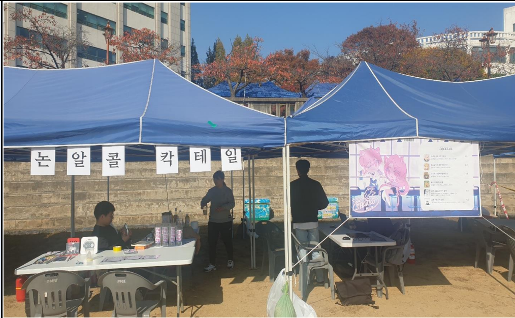
활동사진 (3매 이상)