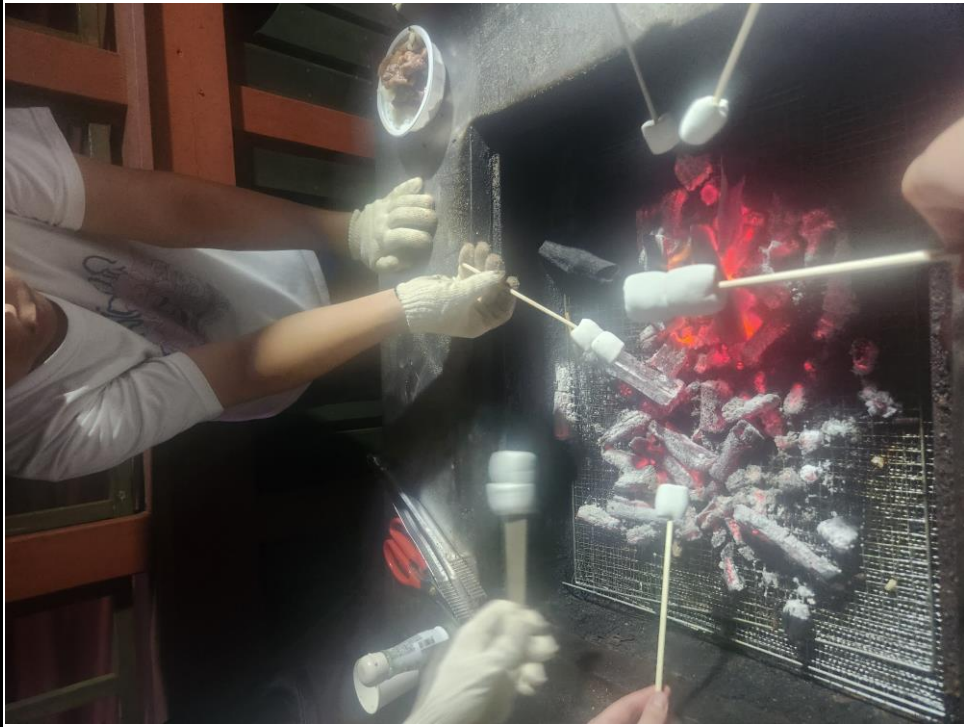
활동사진 (3매 이상)