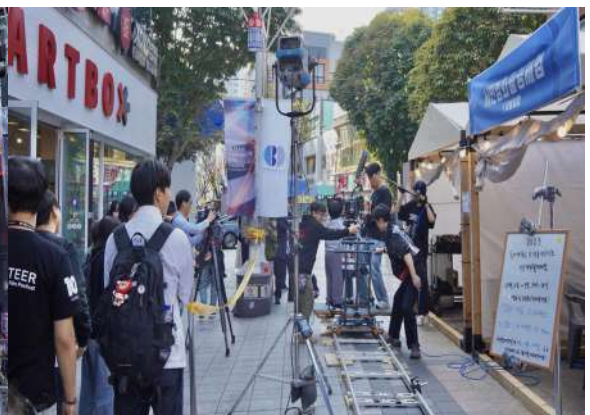
활동사진 (3매 이상)