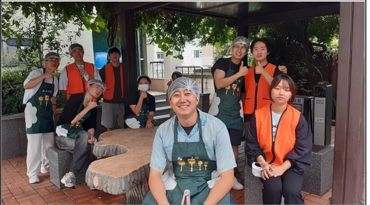
활동사진 (3매 이상)