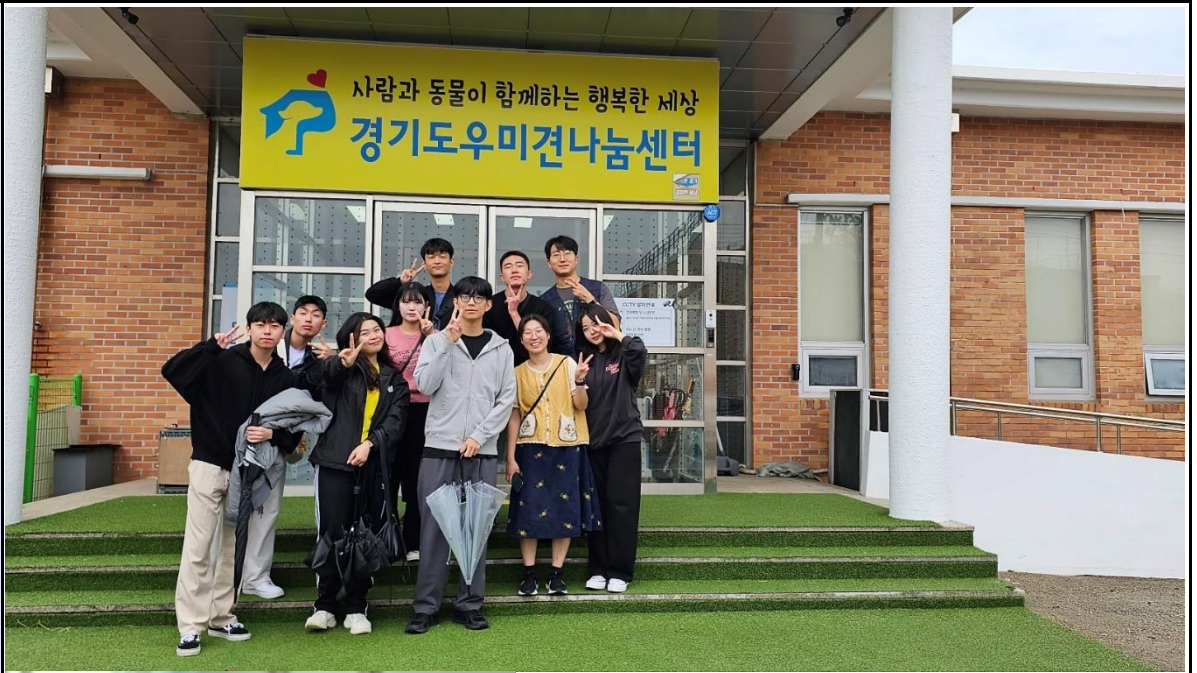
활동사진 (3매 이상)