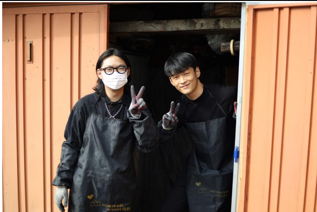
활동사진 (3매 이상)