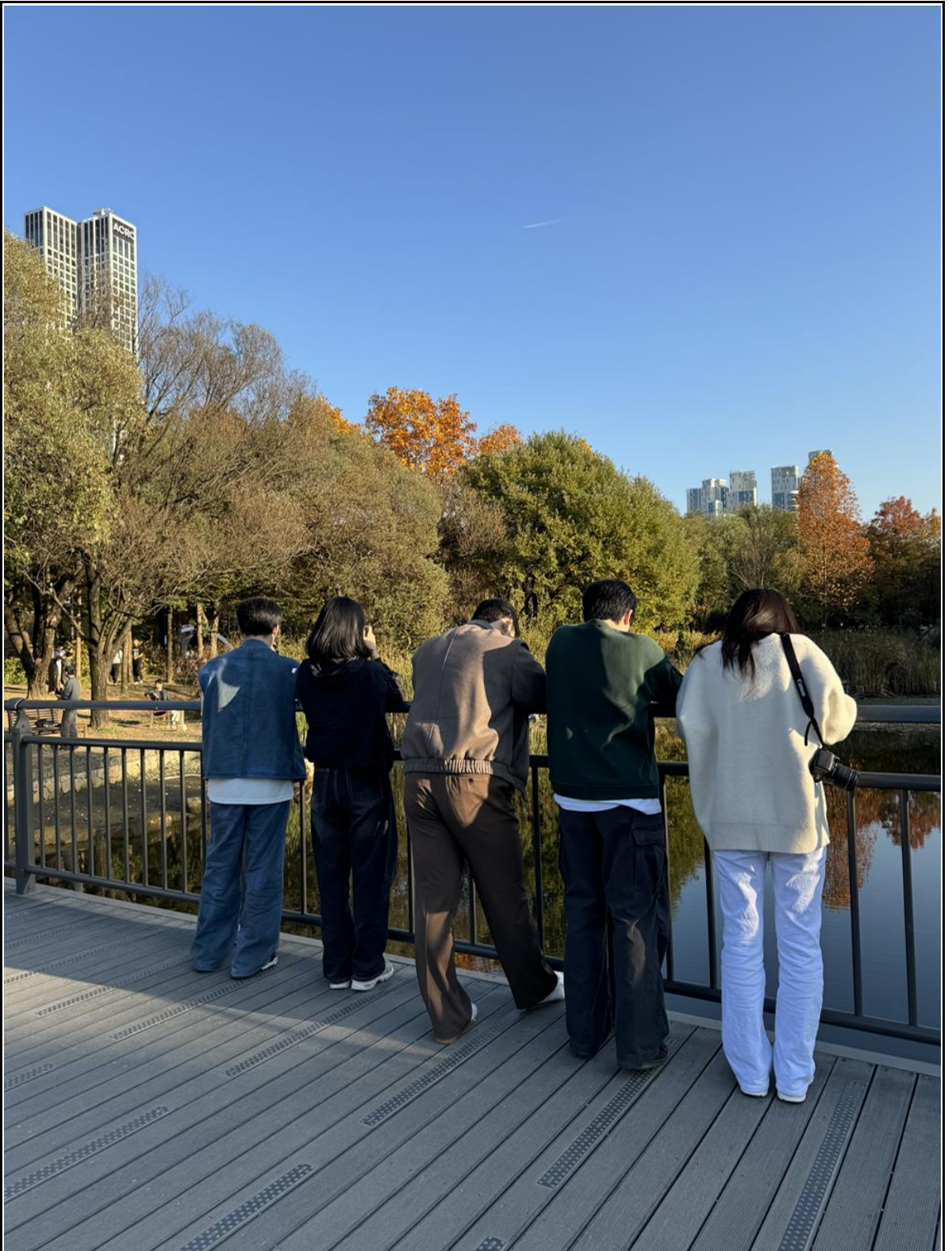
활동사진 (3매 이상)