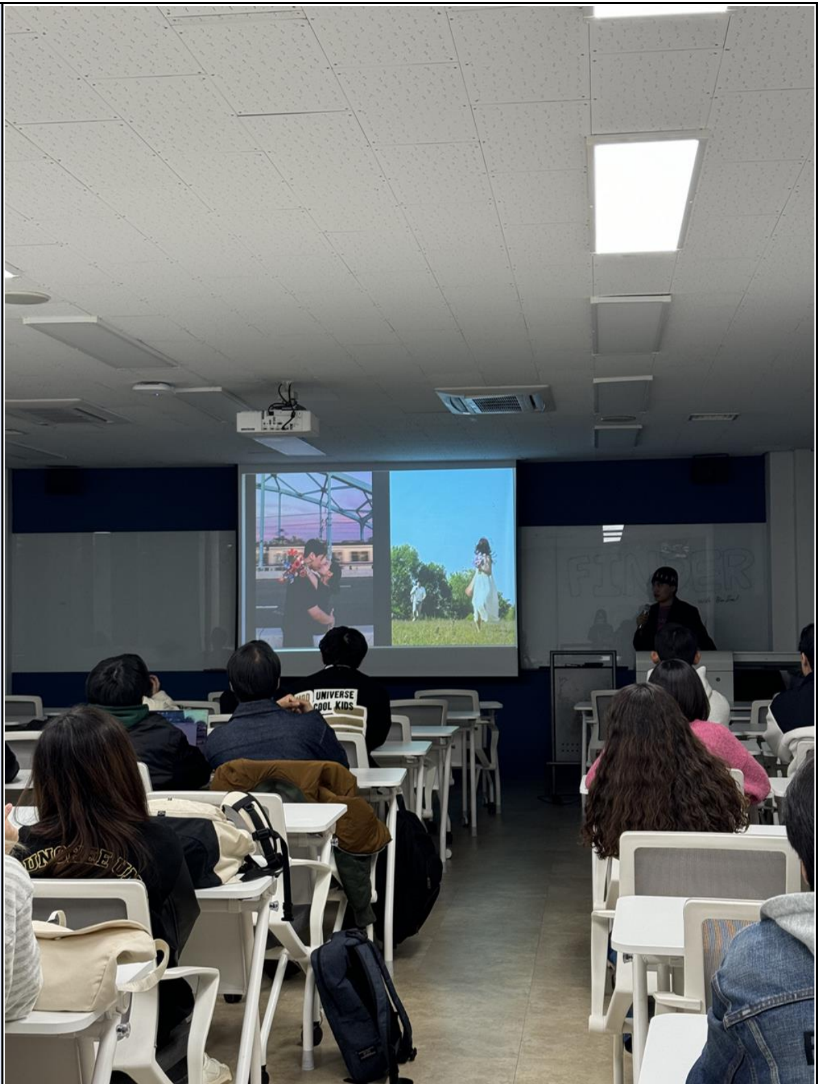
활동사진 (3매 이상)