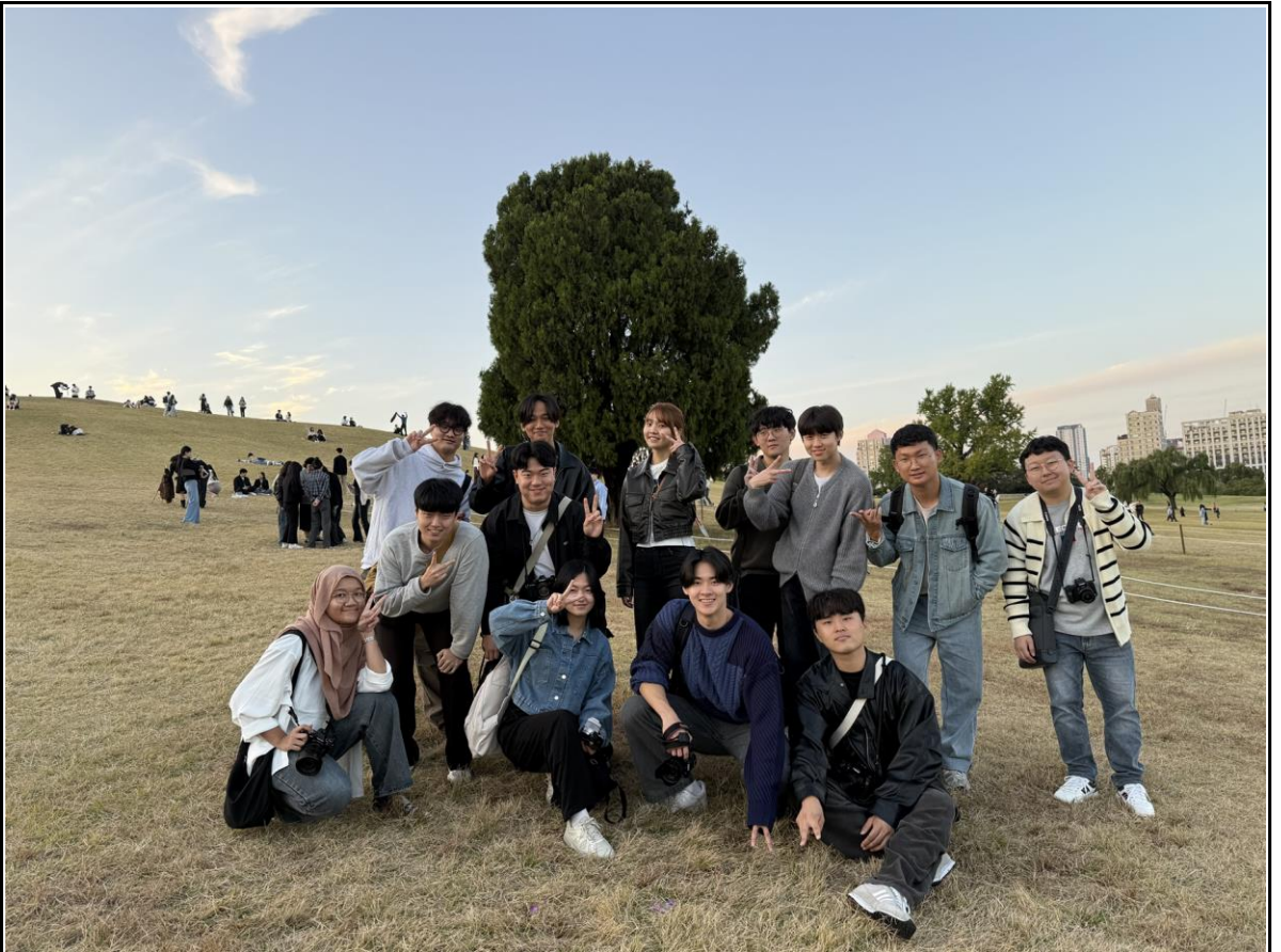
활동사진 (3매 이상)