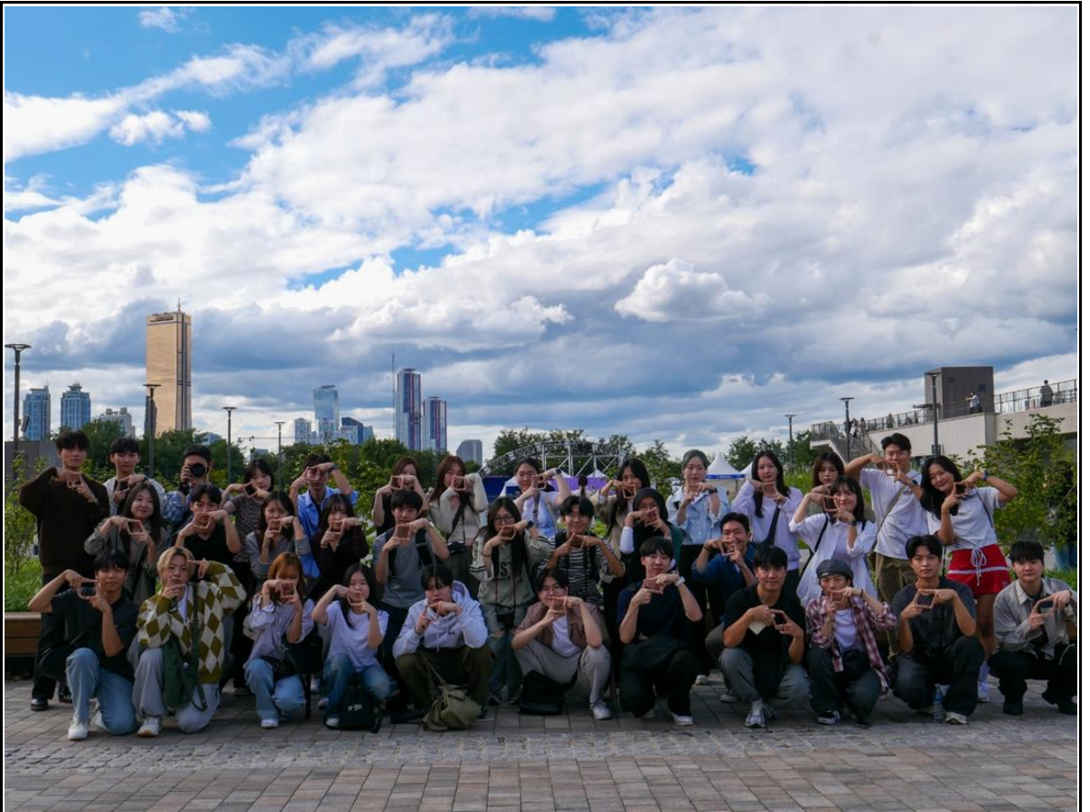
활동사진 (3매 이상)