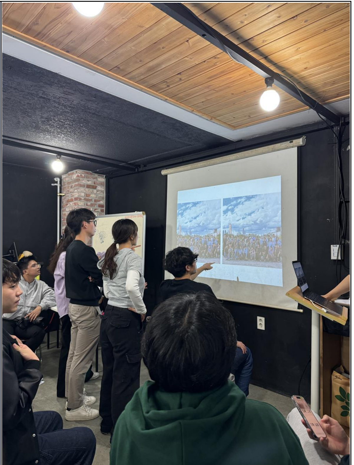
활동사진 (3매 이상)