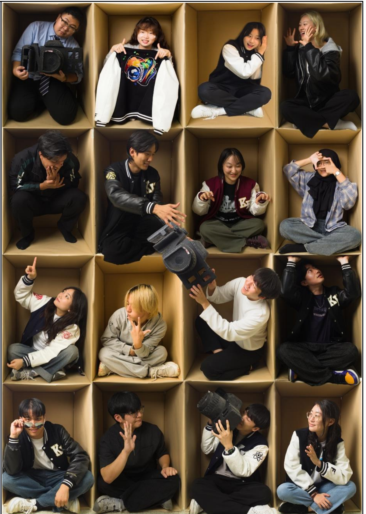
활동사진 (3매 이상)