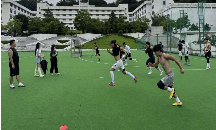
1차 합숙 훈련 인증 사진