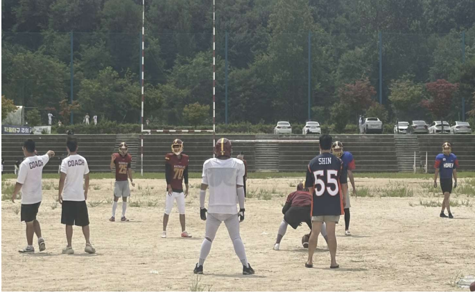
1차 합숙 훈련 인증 사진