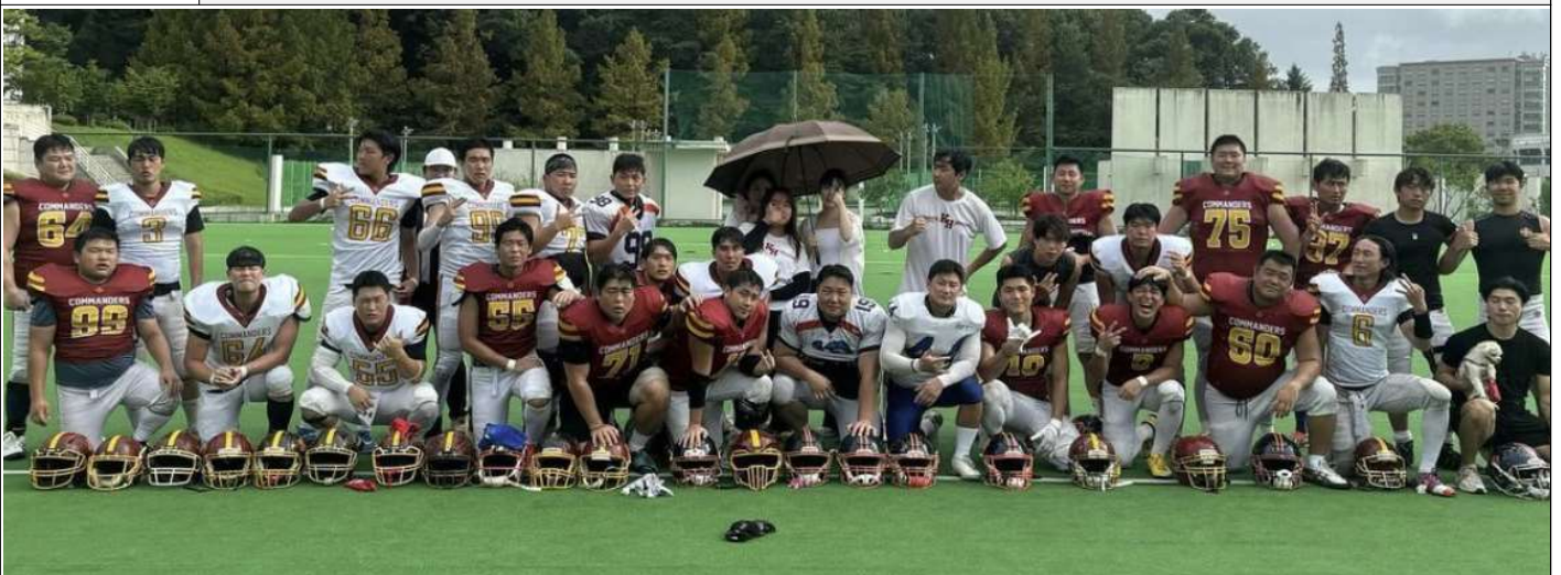
7월26일 자체전 인증 사진