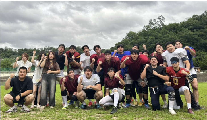
1차 합숙 훈련 오후완 인증 사진