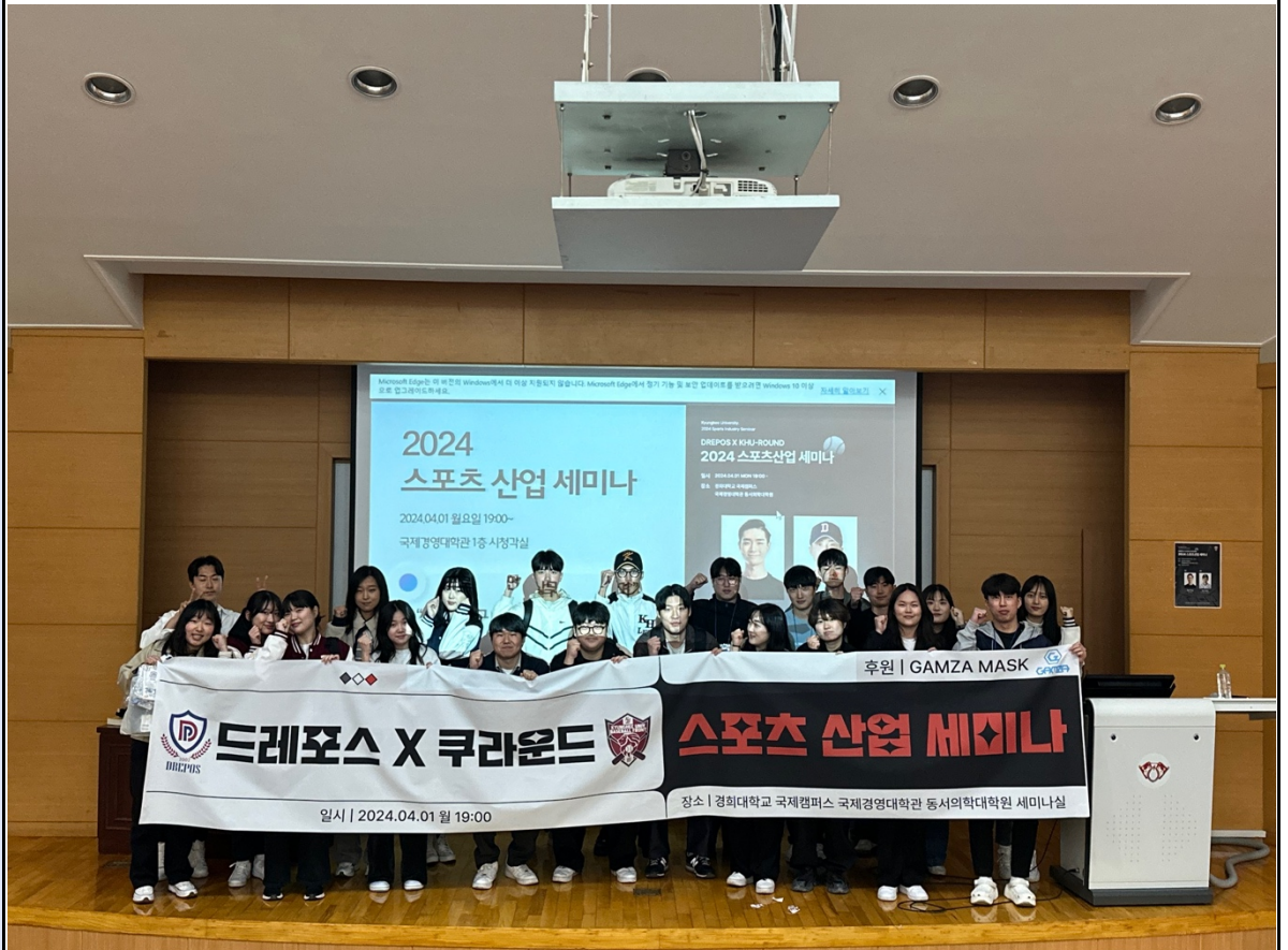
활동사진 (3매 이상)