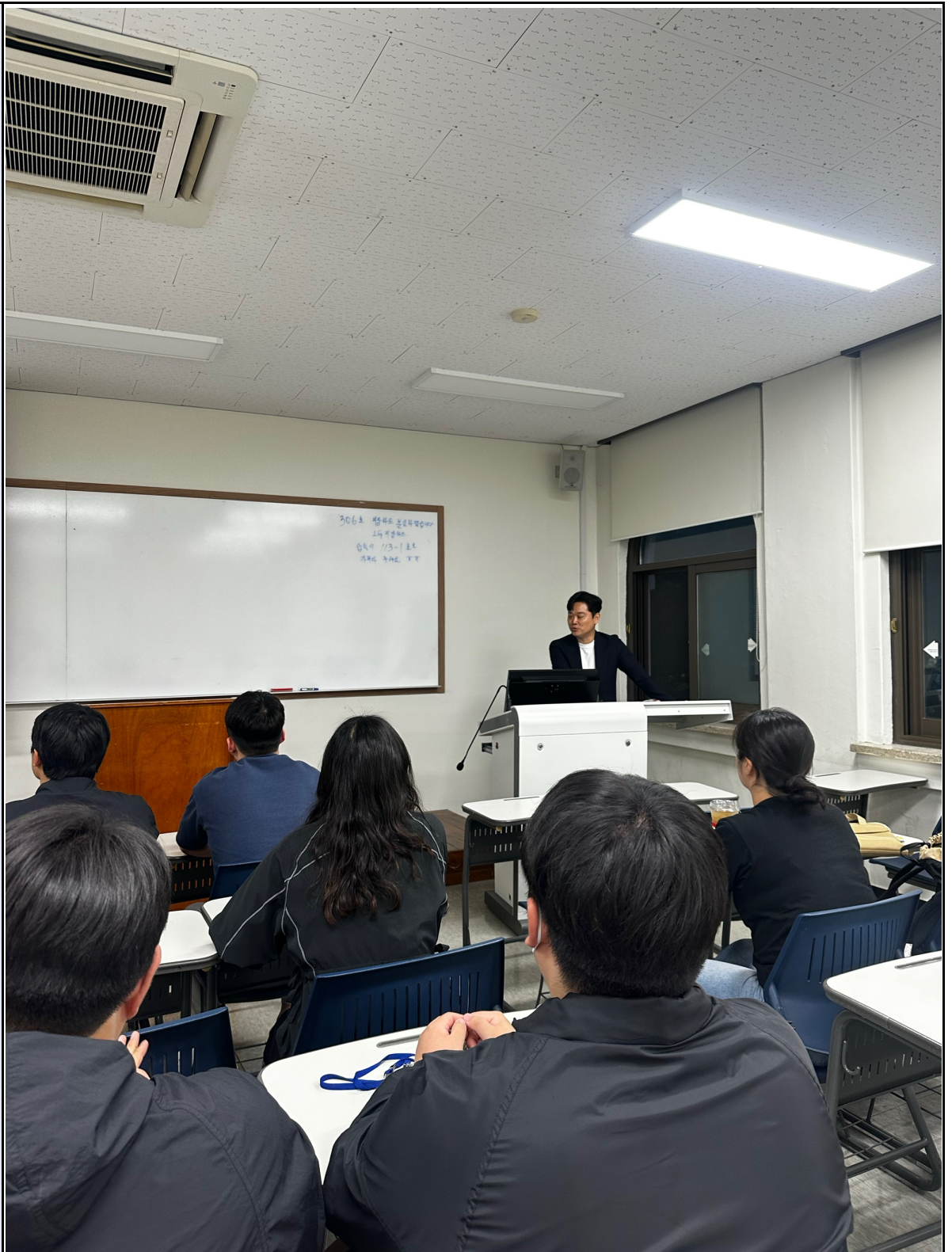
활동사진 (3매 이상)