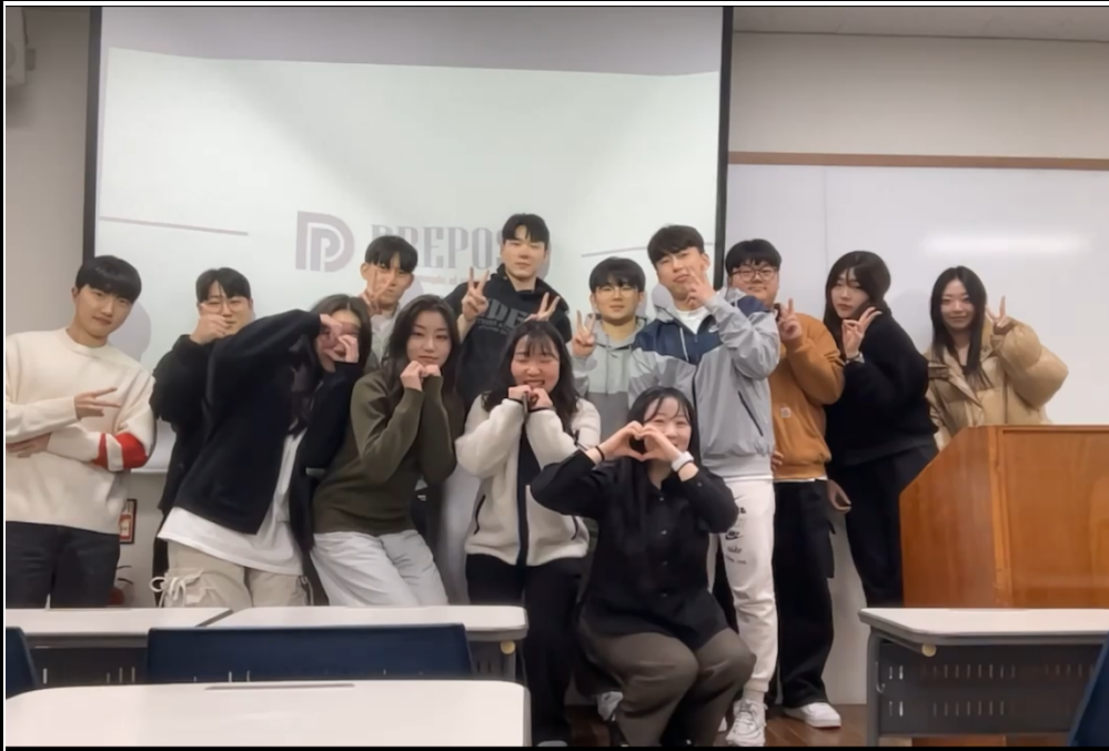
활동사진 (3매 이상)