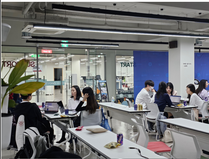
활동사진 (3매 이상)