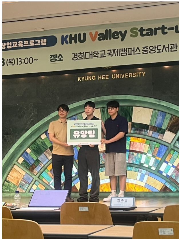
활동사진 (3매 이상)