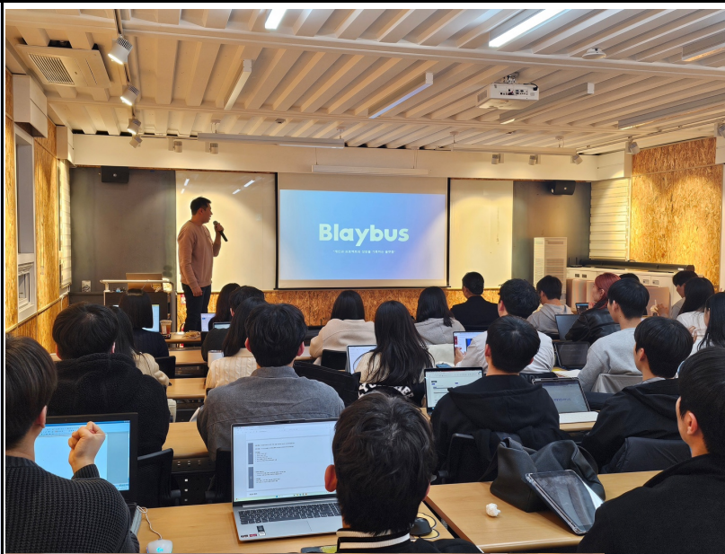
활동사진 (3매 이상)