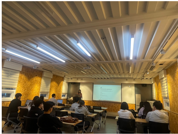
활동사진 (3매 이상)